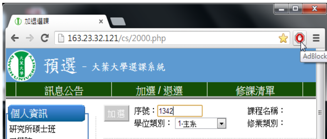
圖 1 右上角游標所指處表示 AdBlock 正在作用中